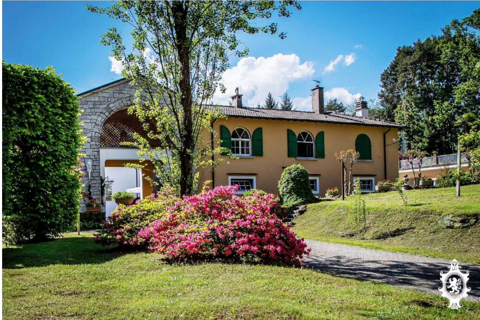
Limitrofi Vergiate (VA)