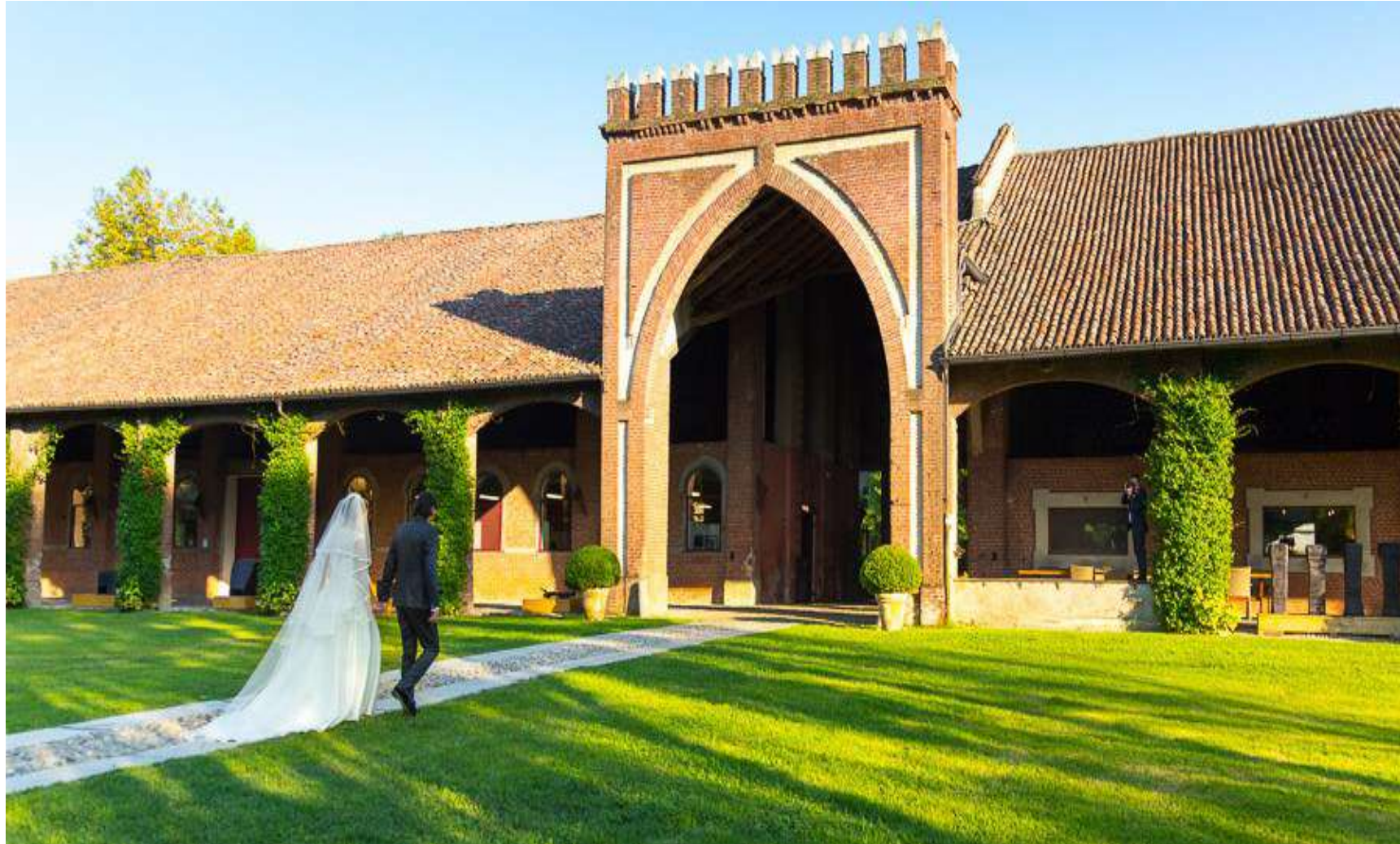
Olevano di Lomellina (limitrofi Novara)