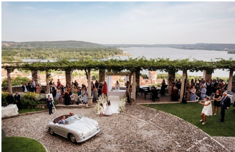
Cerimonia al Belvedere (max 40 persone)