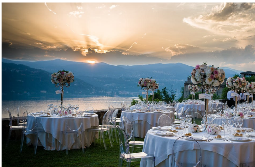
Cena nella Terrazza Panoramica