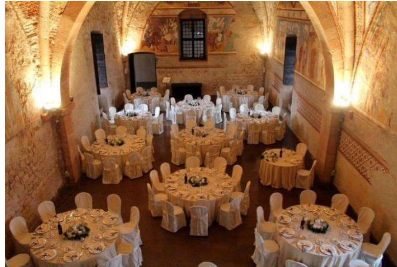
Sala Della Giustizia