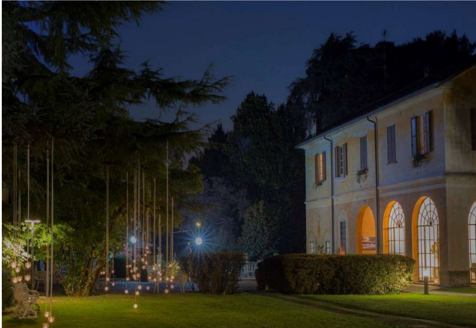
Limitrofi Tradate (VA)