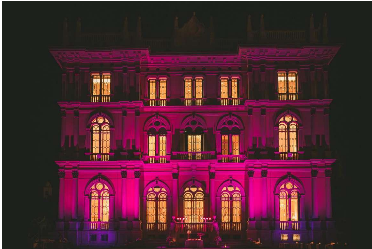
Effetti ricolorazione facciata da quotarsi a parte