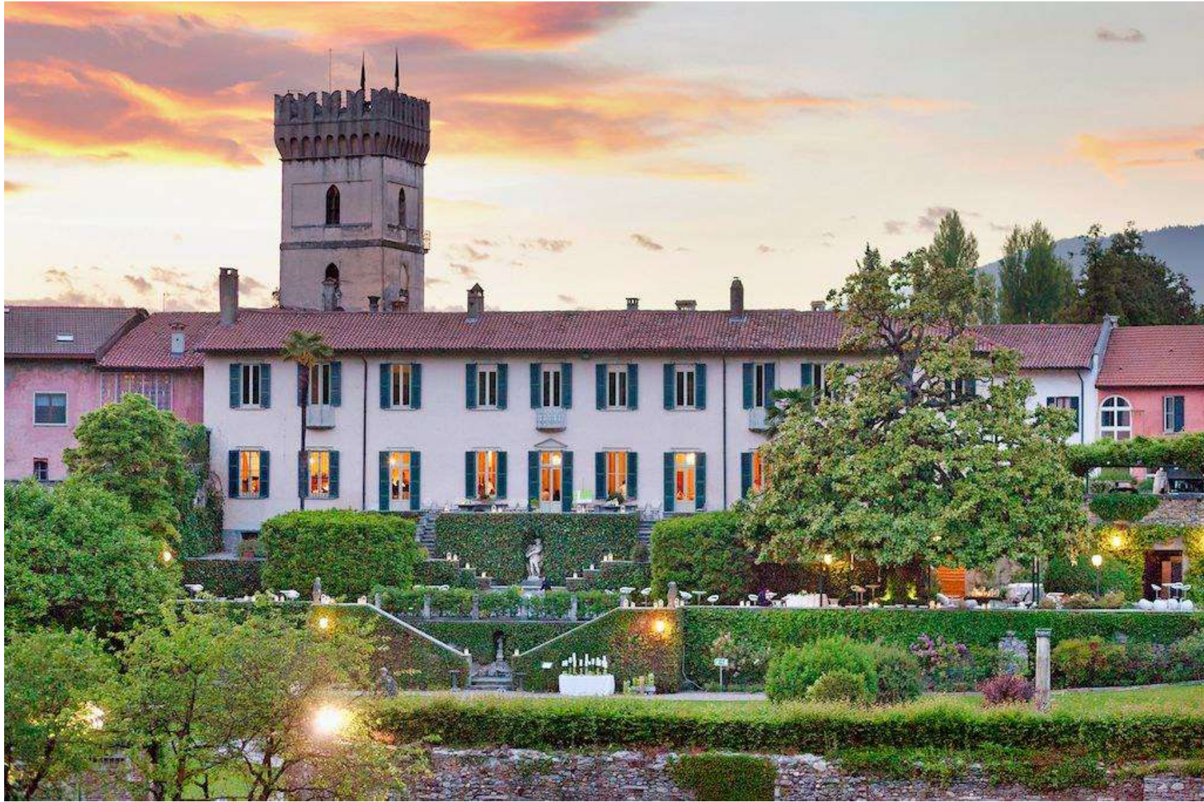
Limitrofi Azzate (VA)